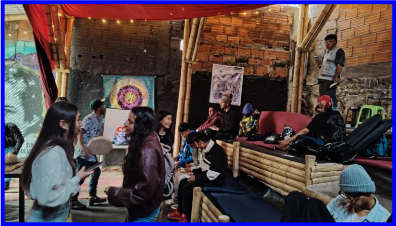
Evidencia fotográfica de la reunión 7 de mayo de 2026